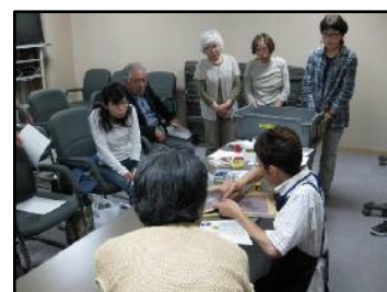
図書館ボランティア(修理班)研修