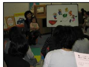
子ども読書の日イベント 親子で楽しむ読書

③ インターンシップ 県立高等養護学校3年生(1名) 県立榛生昇陽高等学校2年生(3名) のべ7日間